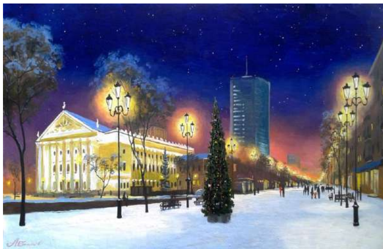
«Пешеходная улица Кировка» Болотов А.

Мороз. Если елочки в домах В ярких бусах и огнях, Если водим хоровод, Что встречаем? Новый год. (Т. Гусарова)