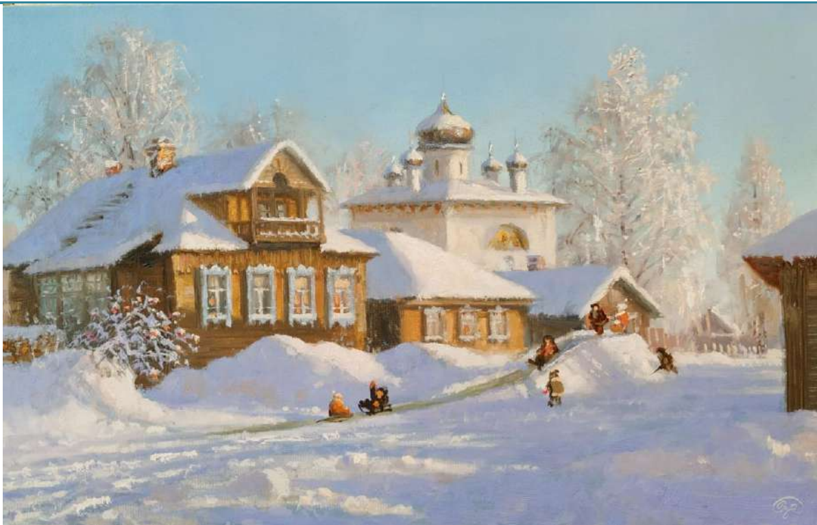
«Веселая зима» Жданов В.Ю.