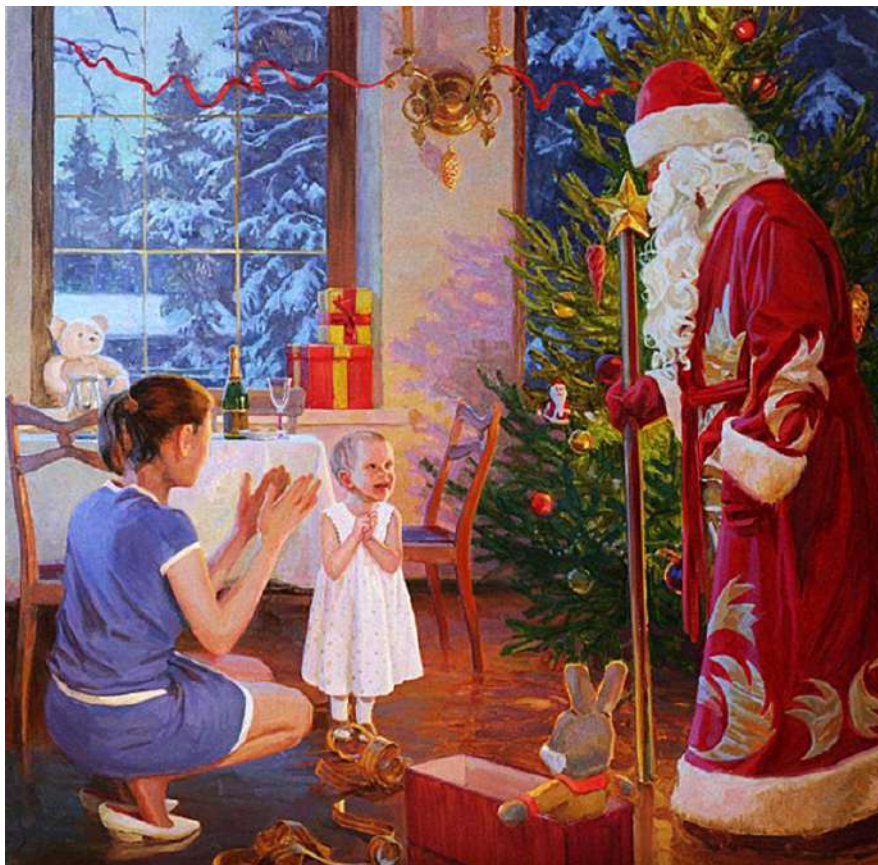
«Дед Мороз пришел» Пантелеев С.

Прекрасная командная игра, в которой принимают участие взрослые и дети. Всех деток делим на команды, чтобы количество было примерно одинаковым. В каждую детскую команду добавляем по одному взрослому,