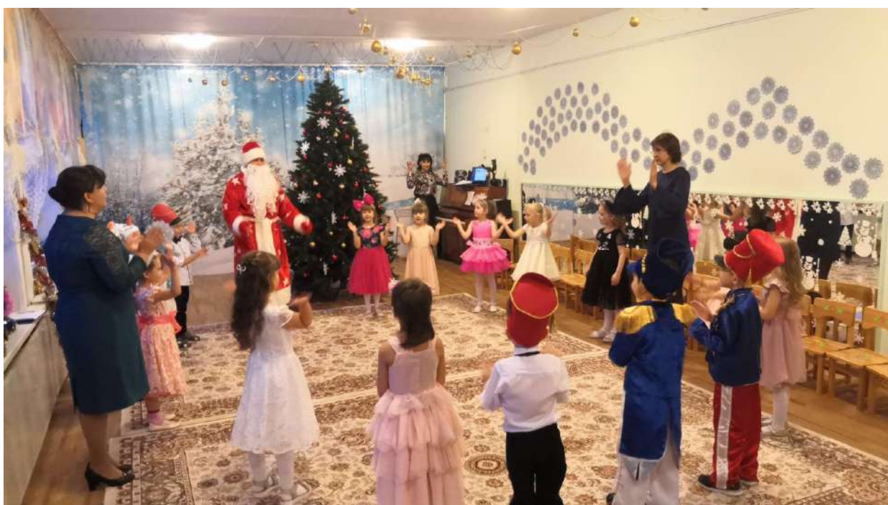
Ребята из группы «Мотыльки» соскучились по Деду Морозу.