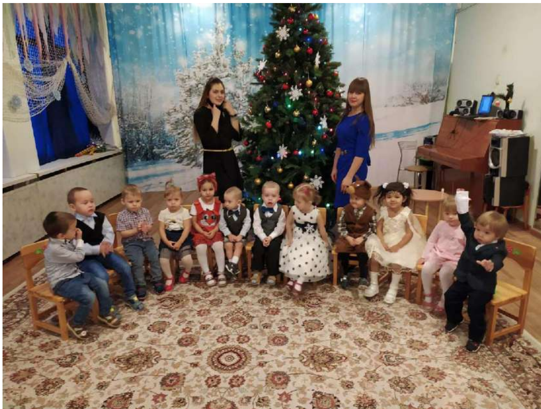
А вот и первый новогодний утренник у группы «Кроха».

И самое главное наш коллектив очень старается весело и запоминающее провести утренники. Сценарии новогодних утренников всегда веселые, с различными сюрпризными моментами и харизматичными героями.