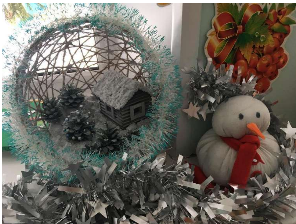
«Волшебный домик» из группы «Малышок»