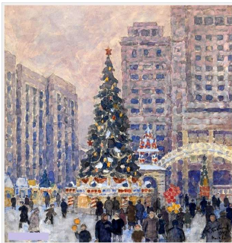
«Новогодняя ёлка на Манежной площади» Бобрышев М.

◆ Дайте ребенку карточку с вашим номером телефона.