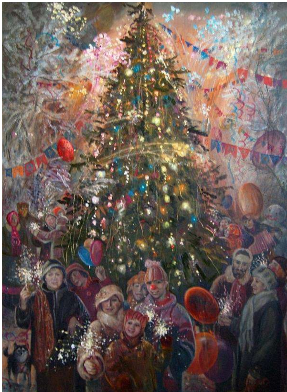
«Ёлка» Широкова И.

Вот и все правила, не забудьте с детьми их проговорить и повторить. И тогда праздник действительно будет очень и очень веселым и полным только чудес.